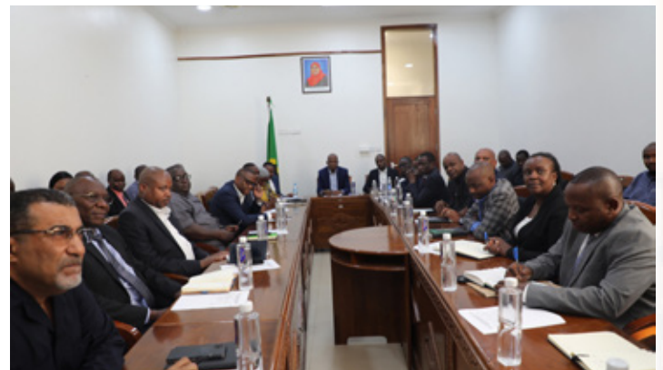
Waziri wa Nishati, January Makamba akiongoza kikao cha Menejimenti ya Wizara ya Nishati kilichofanyika Makao Makuu ya Wizara ya Nishati jijini Dodoma tarehe 10 Januari 2022.