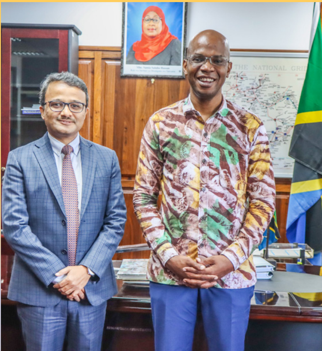
Waziri wa Nishati, January Yusuph Makamba (kulia) akiwa na Balozi wa India nchini Tanzania Mhe. Binaya S. Pradhan baada ya kukutana na kufanya mazungumzo Januari 5, 2022 katika ofisi za Wizara jijini Dar es Salaam.

“Serikali ya India kwa kushirikiana na sekta binafsi imejipanga kuendelea kufanya uwekezaji kwenye maeneo mbalimbali ya kimaendeleo duniani kote, ikiwemo nchini Tanzania,” aliongeza.