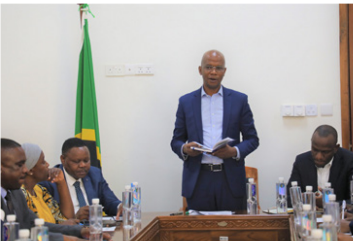
Waziri wa Nishati, January Makamba, akizungumza katika kikao cha Menejimenti cha Wizara ya Nishati kilichofanyika Makao Makuu ya Wizara ya Nishati Jijini Dodoma tarehe 10 Januari 2022.

kutoa ushirikiano kwa watumishi wa Wizara hiyo na kuwataka kumuunga mkono katika majukumu yake.